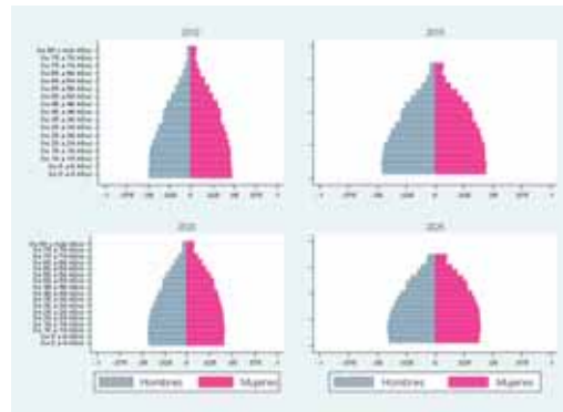
GRÁFICA N° 2 Proyecciones poblacionales